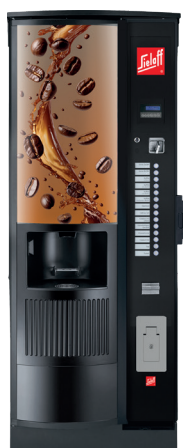
CIS/CVS 500 RB RO Design B