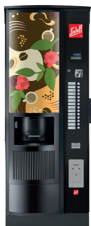
CIS/CVS 500 RB RO Design C