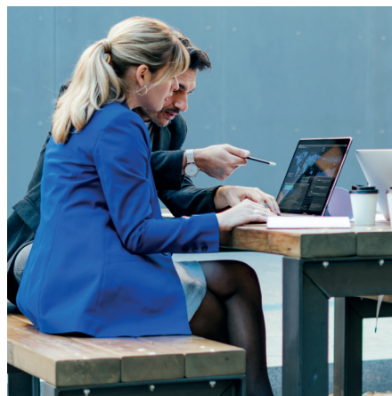
Besten Genuss Draußen, wenn das Wetter sich für ein Treffen im Park eignet