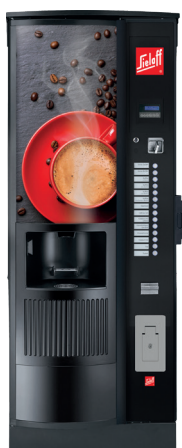
CIS/CVS 500 RB RO Design A