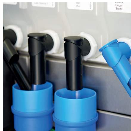
Für den individuellen Einsatz sorgt die hohe Variantenvielfalt