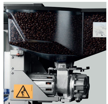
Hochwertige Komponenten aus dem HoReCa-Bereich