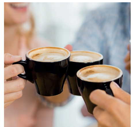
Die ausgezeichnete Kaffequalität und große Produktvielfalt überzeugen