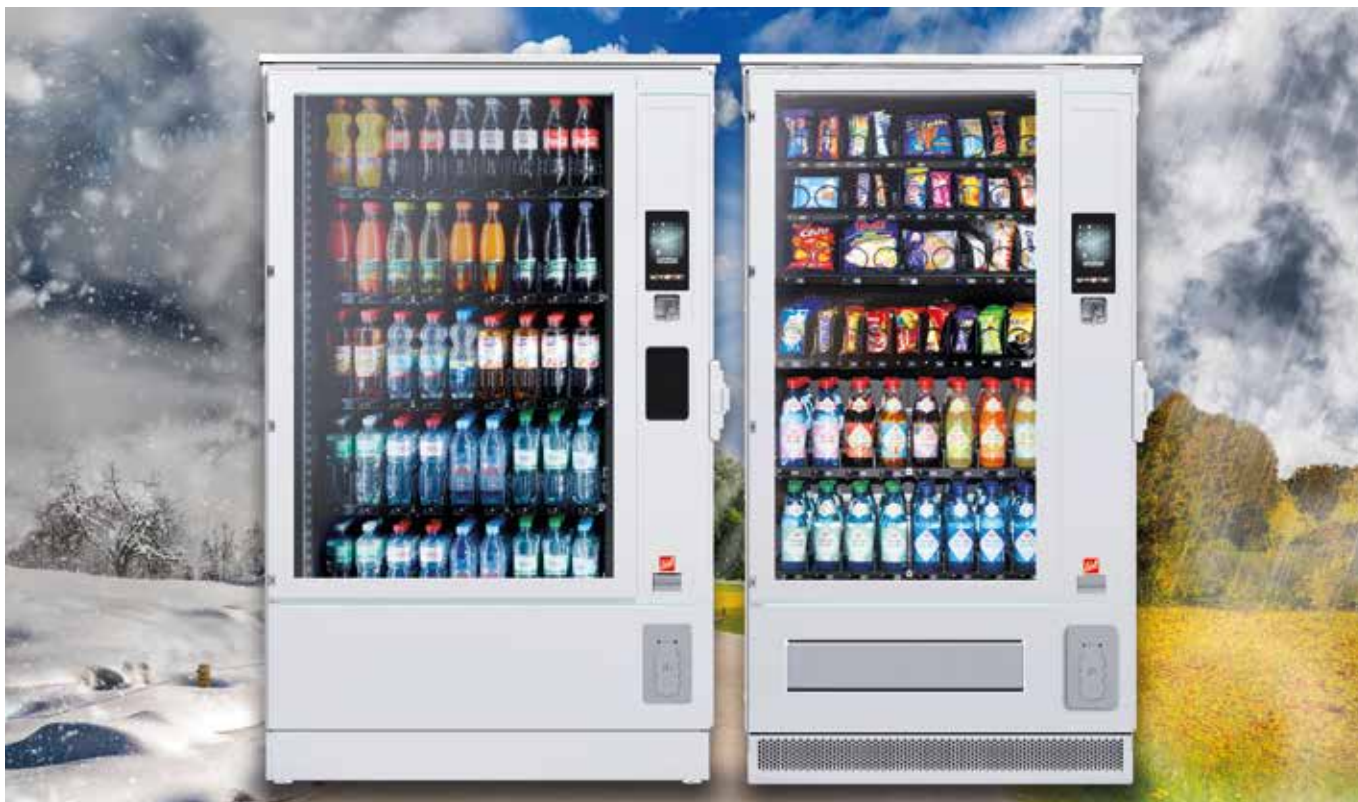
SiLine® GF L RO in Standardfarbe RAL 9010

SiLine® Outdoor – bei jedem Wetter einsatzbereit, nur ein Stromanschluss ist notwendig