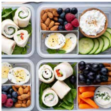
Bieten Sie z. B. saisonales Obst und Gemüse, fertige Gerichte und mehr im SiLine® Outdoor

*Standortbedingte Abweichungen möglich, direkte Sonneneinstrahlung vermeiden