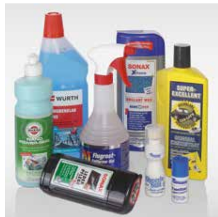
Auch außerhalb der Geschäftszeiten überzeugt vielfältiges Angebot die Kunden.