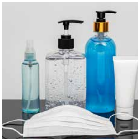
Verkaufen Sie Produkte im Food- und Non-Food-Bereich, Hygieneartikel usw.